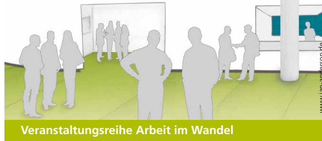
Veranstaltungsreihe Arbeit im Wandel

Die Veranstaltungsreihe „Arbeit im Wandel“ unterstützt Firmen dabei, ihre Personalarbeit an veränderten Rahmenbedingungen auszurichten. Technisch-ökonomische Entwicklungen wie Digitalisierung, steigende Arbeitsdichte und höhere Komplexität treffen auf gestiegene Ansprüche der Mitarbeiter nach Arbeitsqualität, Individualisierung und Work-Life-Balance. Im Mittelpunkt der Veranstaltungen stehen Wissenstransfer, Erfahrungsaustausch und Vernetzung. Die Reihe richtet sich an Personalverantwortliche vor allem von kleinen und mittleren Unternehmen.